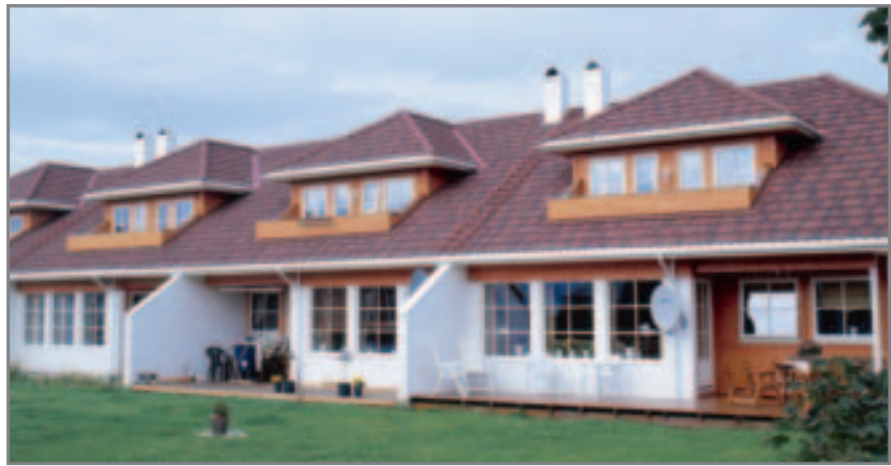
Isola Powertekk Rustikk-rød