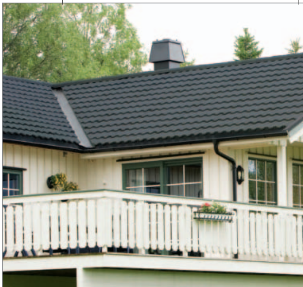
Isola Powertekk Sort

Isola Powertekk har stor styrke kombinert med lav vekt. Dette gir en unik kombinasjon av egenskaper og fordeler. Det tiltalende utseende sammen med et bredt fargeutvalg betyr at du kan få et tak som er tilpasset de fleste krav til miljø, huseksteriør og funksjon.