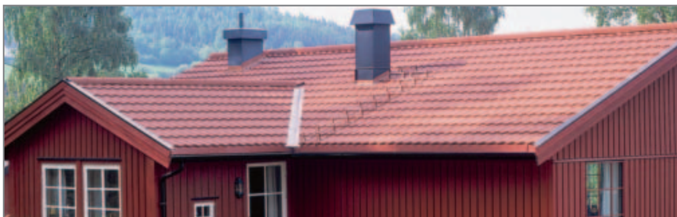
Isola Powertekk Tegl rød