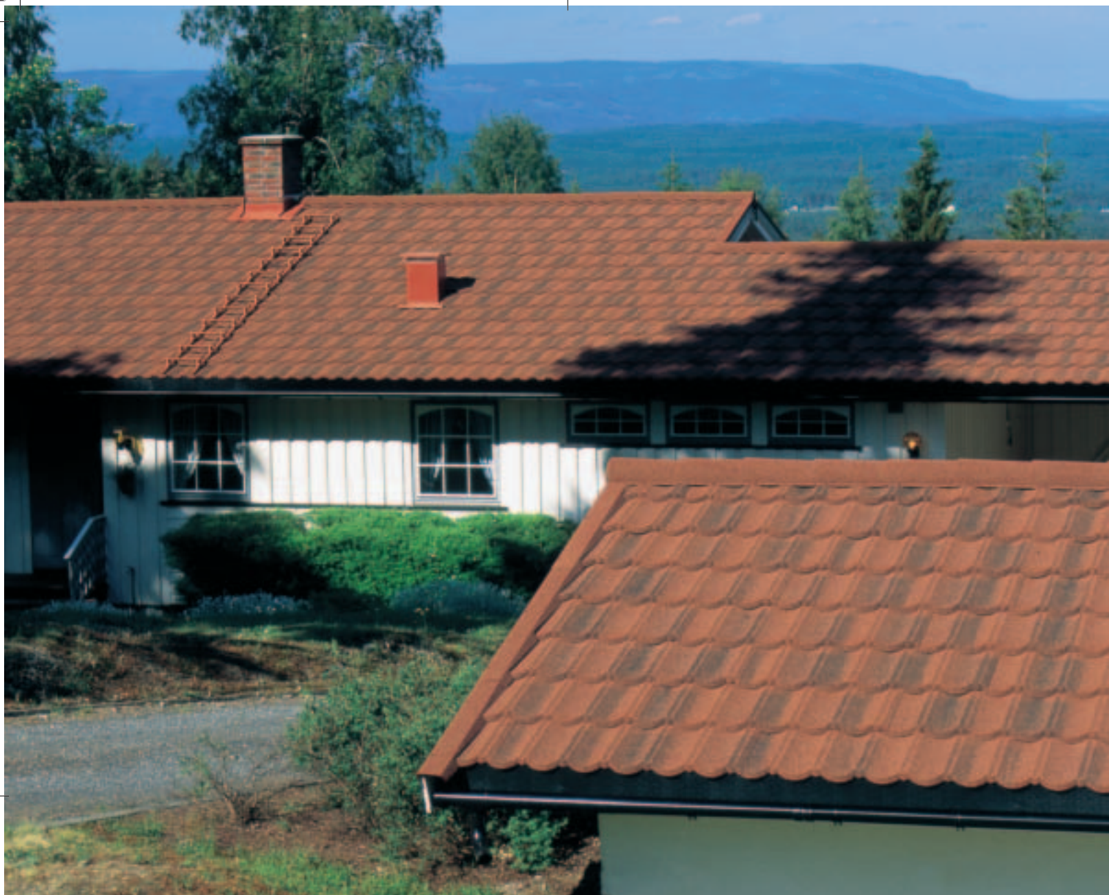
Isola Powertekk Rustikk-rød.