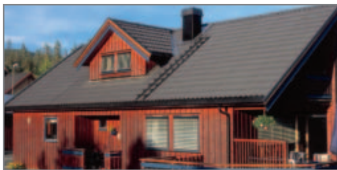
Isola Powertekk Sort