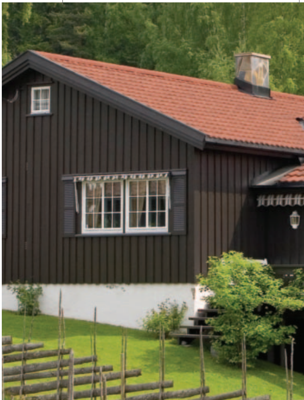
Isola Powertekk Rustikk-rød