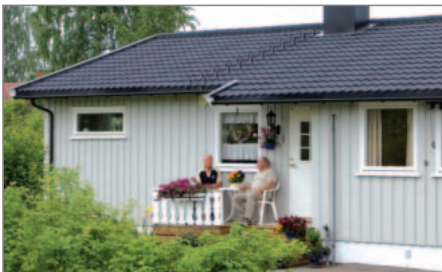
Isola Powertekk Sort

Den lette vekten, kun 7,7 kg/m 2 gjør Powertekk egnet til de fleste takkonstruksjoner- på nye såvel som på gamle tak. Produktets lave vekt betyr også at Powertekk er rasjonell å håndtere på byggeplass. Er taket mindre enn 148 m 2 får du faktisk "hele taket" på en pall.