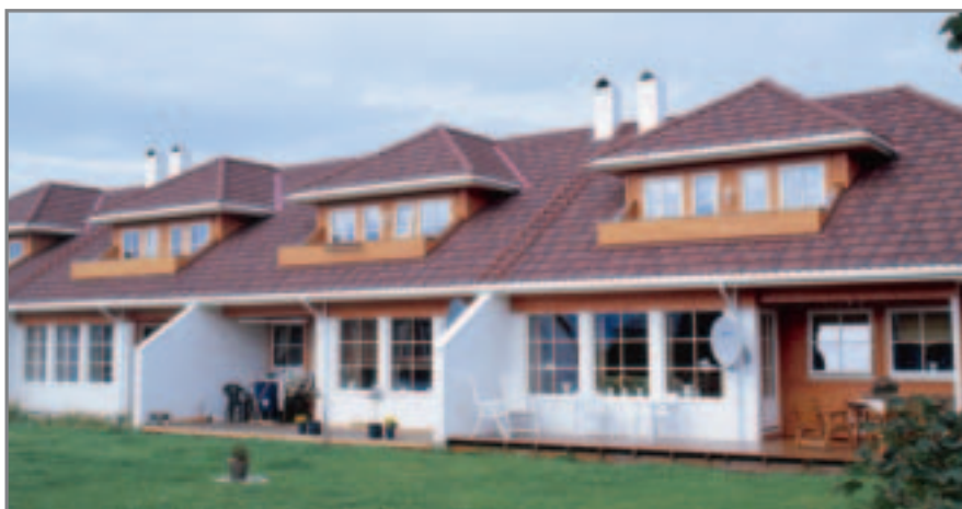
Isola Powertekk Rustikk-rød