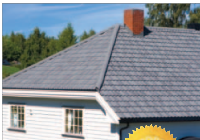
Isola Powertekk Grå Struktur