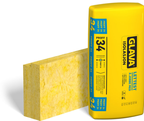
Plate i Proff-familien til varmeisolerings av tak med kaldt loft. Platen har utskjæring på den ene siden for undergurten i takstolen slik at det oppnås et sammenhengende isolasjonssjikt over undergurt. Tilpasset undergurt med bredde 36 mm og 48 mm og høyde inntil 148 mm. Ved større høyder må utskjæringen tilpasses.

Egenskap ved brannpåvirkning klasse (Euroclass) A1, det vil si ubrennbar.