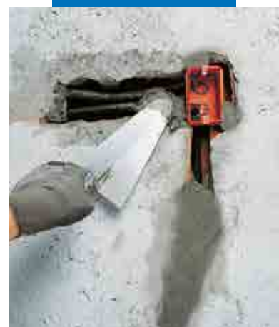
Festing av kabelrør og kapsler med Lampocem