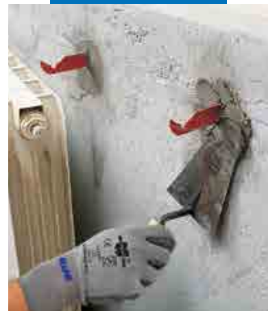
Festing av forankringsbolter til radiatorer med Lampocem