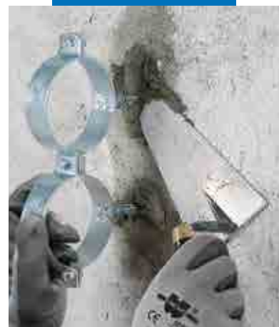
Festing av rørbraketter med Lampocem