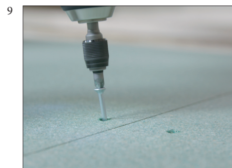
9 Det skal brukes min. 3 skruer på tvers av platene ved hver understøttelse.