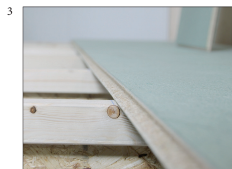
3 Vær nøye sånn at første platerad blir helt rett. Benytt krittsnor.