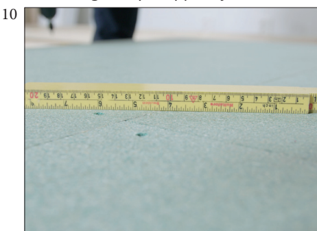
10 Skruer skal forsenkes 2-3 mm ned i platen. Hullene må ikke sparkles da hodet kan komme opp når bjelkene krymper.