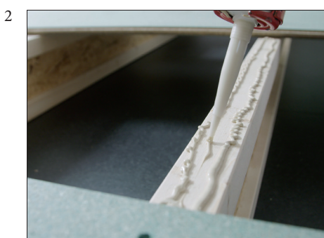
2 Min. 2 limstrenger på bjelkene.