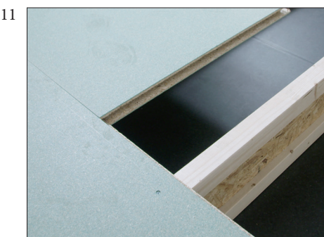
11 Om ønskelig kan disse platene skjøtes mellom bjelkelaget.

Forestia Proffgulv produseres av: Forestia AS, Damvegen 31, 2435 Braskereidfoss. Tlf. 38 13 71 00 Mail: kundesenter.forestia@byggma.no web: www.forestia.no