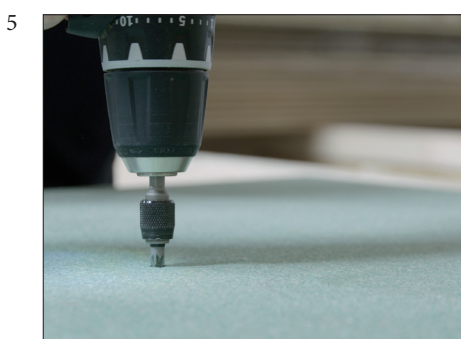
5 Gulvplatene festes til alle understøttelser med skruer