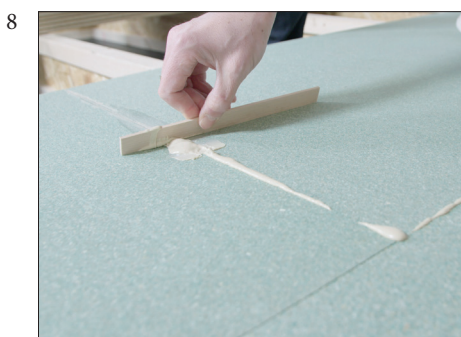
8 Overflødig lim fjernes.