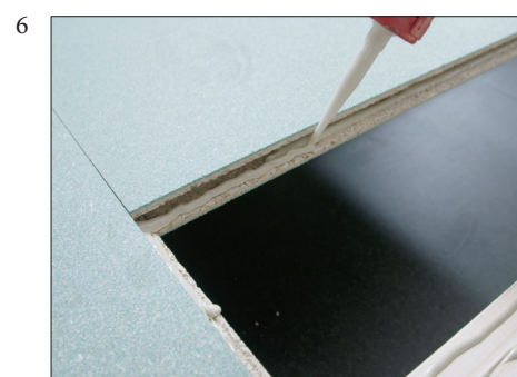
6 Platens profiler skal full-limes