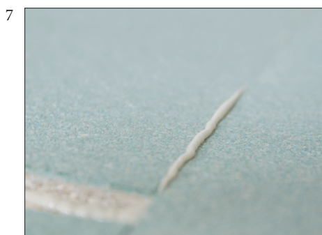
7 Når platene er klikket sammen skal overflødig lim tyte opp i skjøten.