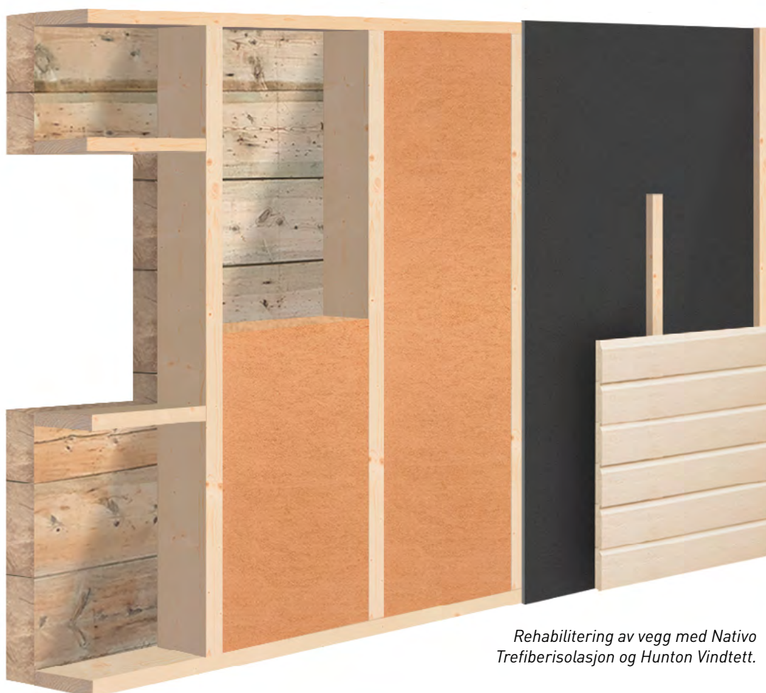
Rehabilitering av vegg med Nativo Trefiberisolasjon og Hunton Vindtett.

Se også Hunton Konstruksjonsoversikt hvor eksempler med dokumentert brannmotstand REI45, REI60 og REI90 er beskrevet.