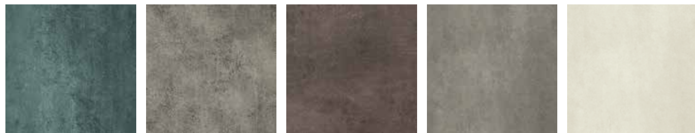
RUST METAL Dark Aqua 2590 5158 KIRUMA Aluminium 2590 5146 KIRUMA Dark Grey 2590 5031 RAW CONCRETE Dark Grey 2590 5136 RAW CONCRETE Medium Grey 2590 5135