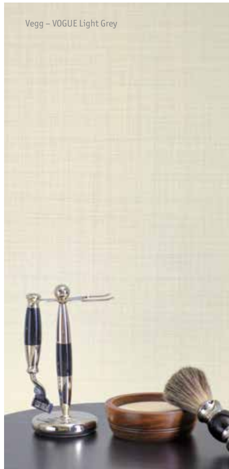
Vegg – VOGUE Light Grey