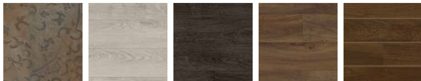
MEDALLION Dark Brown 2590 5137 OAK Grey 2590 5147 OAK Black 2590 5038 OAK Brown 2590 5153 SHIP DECK Silver Brown 2590 5159

Gulvene finnes i to forskjellige utførelser: størst mønster og fargevalg finnes på 2 meters bredde . 2 m gulvene er ftalatfrie.