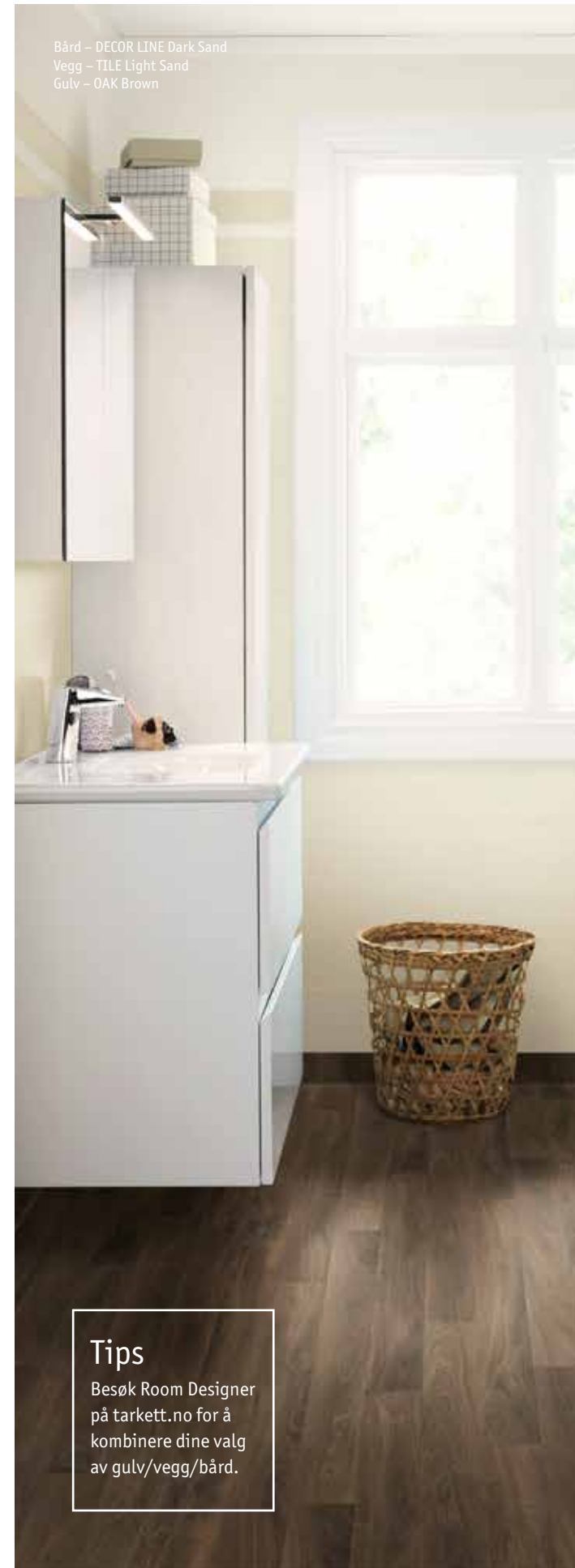
Bård – DECOR LINE Dark Sand Vegg – TILE Light Sand Gulv – OAK Brown

Tips Besøk Room Designer på tarkett.no for å kombinere dine valg av gulv/vegg/bård.