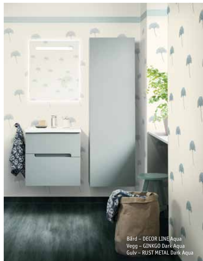
Bård – DECOR LINE Aqua Vegg – GINKGO Dark Aqua Gulv – RUST METAL Dark Aqua

Vaskerommet blir sjeldent prioritert i våre hjem, sannsynligvis fordi vi sjeldent viser det frem til gjester. Likevel er det et rom hvor vi bruker en del tid. Aquarelle-kolleksjonen gjør det enkelt å skape en vakker og trivelig atmosfære når man må vaske eller stryke klær. Gulv som er myke, gode og varme å gå på øker trivselen, og gulvets vanntetthet føles trygt i et rom som ofte må tåle tøffe tak.