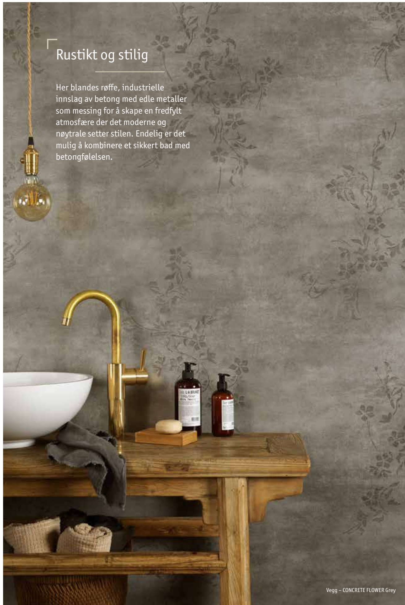
Vegg – CONCRETE FLOWER Grey

Her blandes røffe, industrielle innslag av betong med edle metaller som messing for å skape en fredfylt atmosfære der det moderne og nøytrale setter stilen. Endelig er det mulig å kombinere et sikkert bad med betongfølelsen.