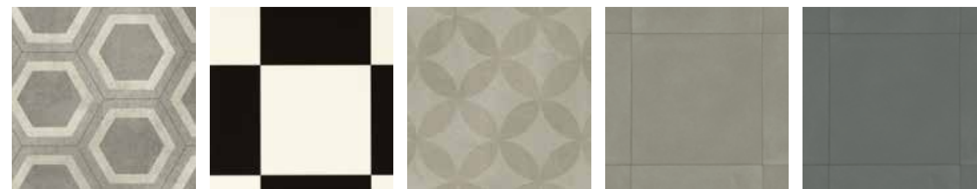
HONEYCOMB TILE Grey 2455 4009 SQUARE Black & White 2455 4003 CIRCLE FLOWER Grey 2455 4010 BALDOSA Graphite 2455 4006 BALDOSA Anthracite 2455 4007

Aquarelle-gulv finnes også i 3 meters bredde , og kan dermed installeres på større bad uten skjøt. For å kunne produsere kolleksjonens fine mønster er beleggets konstruksjon forsterket med glassfiber. Å installere et gulv med glassfiber stiller høyere krav til jevnt underlag og legging. Følg derfor leggeanvisningen på tarkett.no. 3 meters gulvet inneholder gjenvunnet materiale og kan derfor inneholde spor av ftalater.