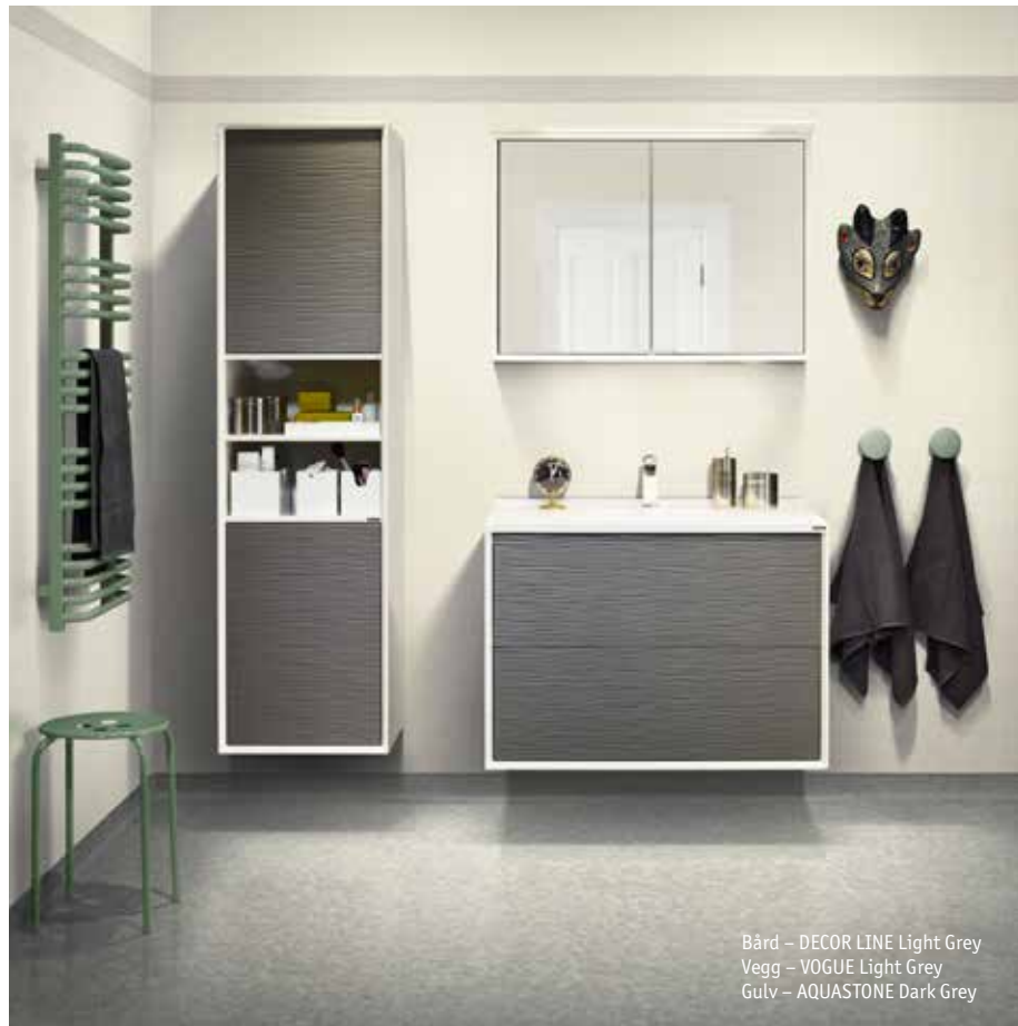
Bård – DECOR LINE Dark Sand Vegg – VOGUE Light Grey Gulv – AQUASTONE Dark Grey