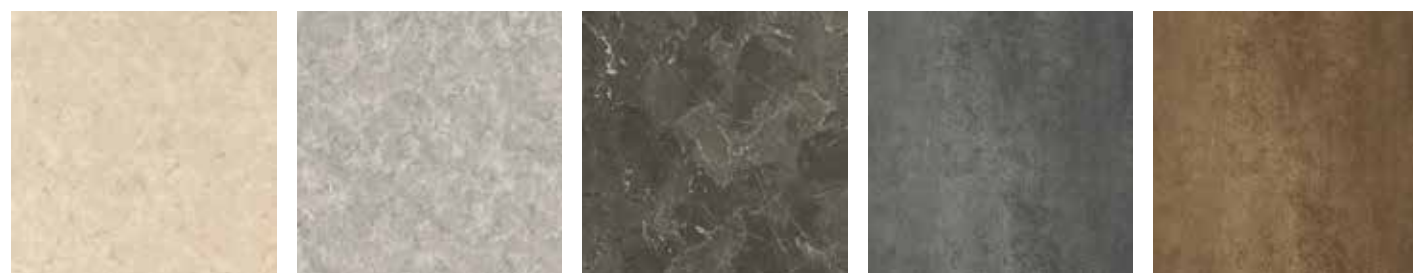
AQUASTONE Beige 2590 5142 AQUASTONE Dark Grey 2590 5014 ROYAL MARBLE Black 2590 5155 RUST METAL Graphite 2590 5156 RUST METAL Dark Copper 2590 5157