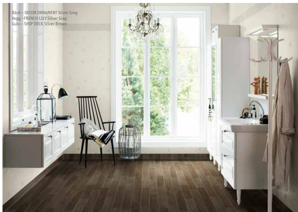
Bård – DECOR ORNAMENT Silver Grey Vegg – FRENCH LILY Silver Grey Gulv – SHIP DECK Silver Brown

Aquarelle er et utmerket valg til badet som i tillegg er veldig lettstelt. Gulv og vegger rengjøres enkelt med en myk svamp, lunken vann og litt universalt rengjøringsmiddel, og tørkes raskt over med en nal. At gulvet i tillegg trekkes et stykke opp på veggen gjør at du får maksimal beskyttelse mot fukt.