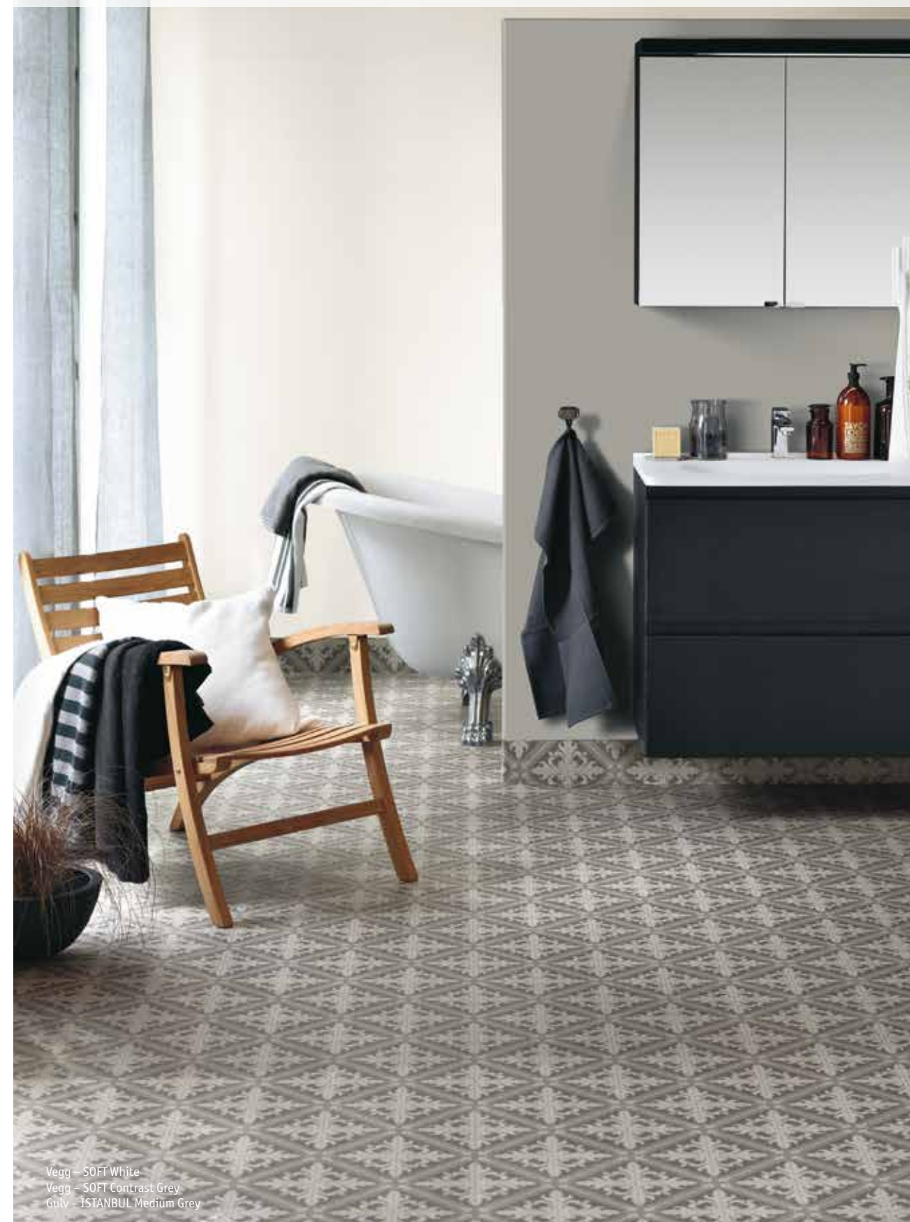
Vegg – SOFT White Vegg – SOFT Contrast Grey Gulv – ISTANBUL Medium Grey

Med fondvegger i avvikende mønstre eller farger kan man skape et spennende miljø. Bildene i denne brosjyren viser mange eksempler på dette. Ved installasjonen monteres grunnveggen oftest rundt hjørnet og 10 cm inn på fondveggsiden. Deretter monteres fondveggen slik at den slutter inne i hjørnet, og deretter tettes skjøten med Aqua-Tett. Fondveggen skal ikke plasseres i våtsone 1, dvs i området der du dusjer/bader.