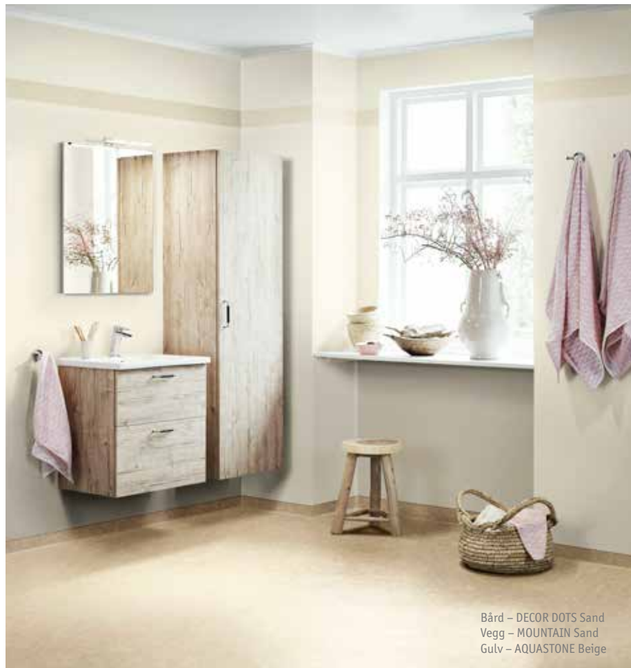
Bård – DECOR DOTS Sand Vegg – MOUNTAIN Sand Gulv – AQUASTONE Beige