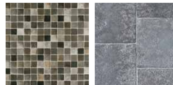
SARONDO Black 5619 037 SELENE Black 5619 036