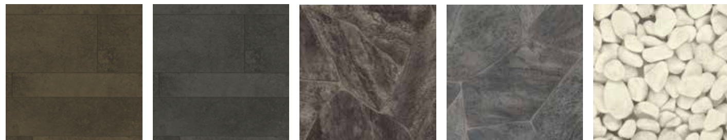
VARIATA Brown 2590 5152 VARIATA Black 2590 5151 SKIFFER Anthracite 2590 5134 SKIFFER Dark Grey 2590 5132 PEBBLE Light Grey 2590 5154