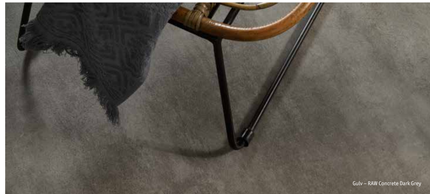
Gulv – RAW Concrete Dark Grey