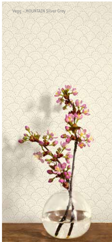
Vegg – MOUNTAIN Silver Grey