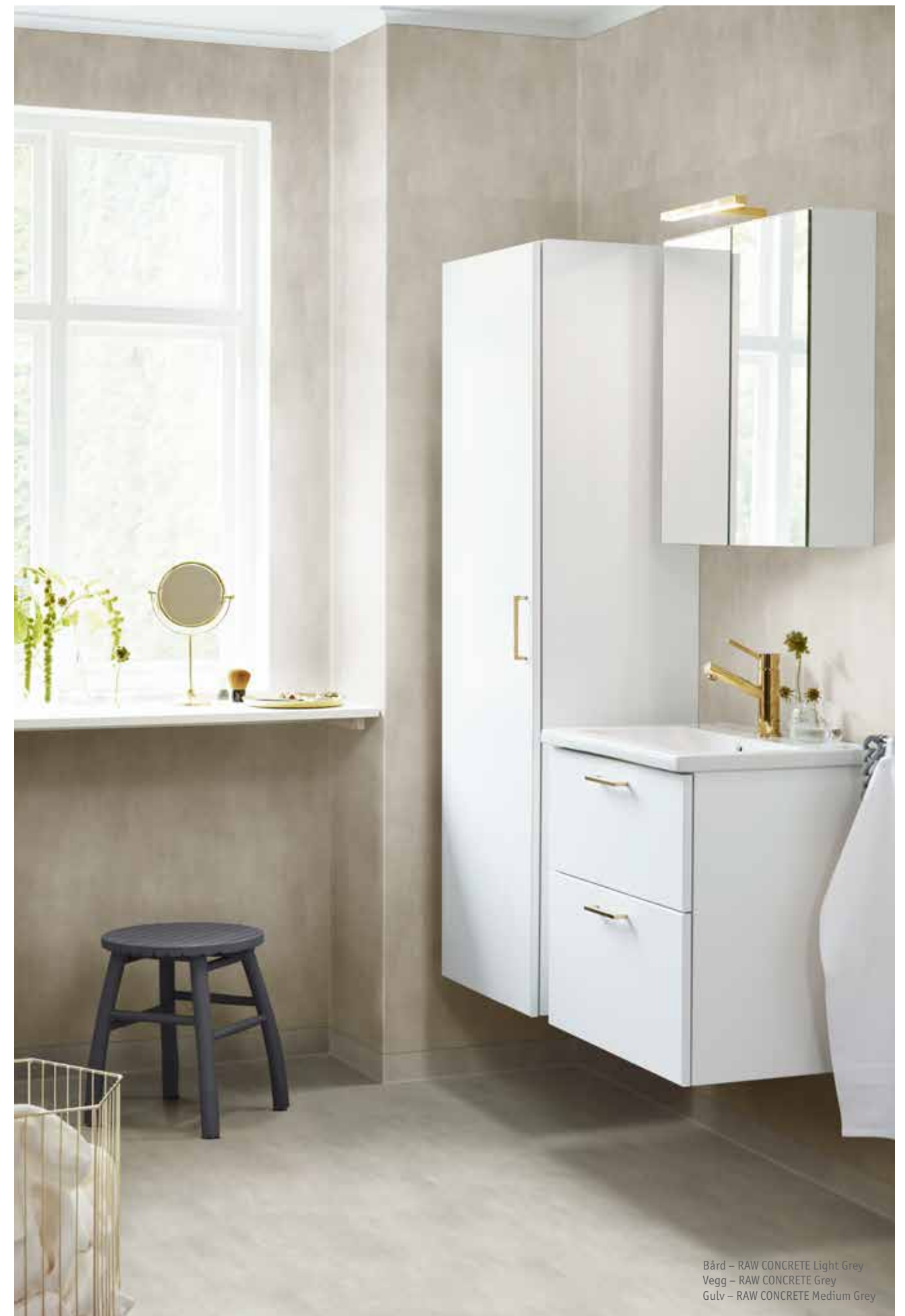
Bård – RAW CONCRETE Light Grey Vegg – RAW CONCRETE Grey Gulv – RAW CONCRETE Medium Grey