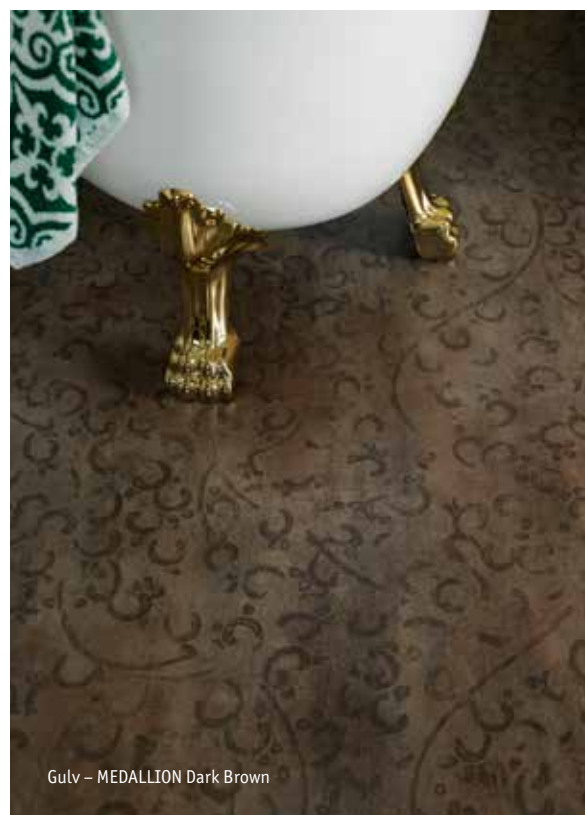
Gulv – MEDALLION Dark Brown

Trykket på vårt veggbelegg "French Lily" varierer i fargestyrke. Noen liljer er mer fremtredende enn andre for å gi følelsen av et håndtrykket mønster.