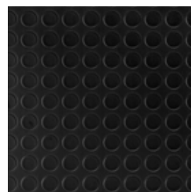
PASTILLES Anthracite 2590 5035