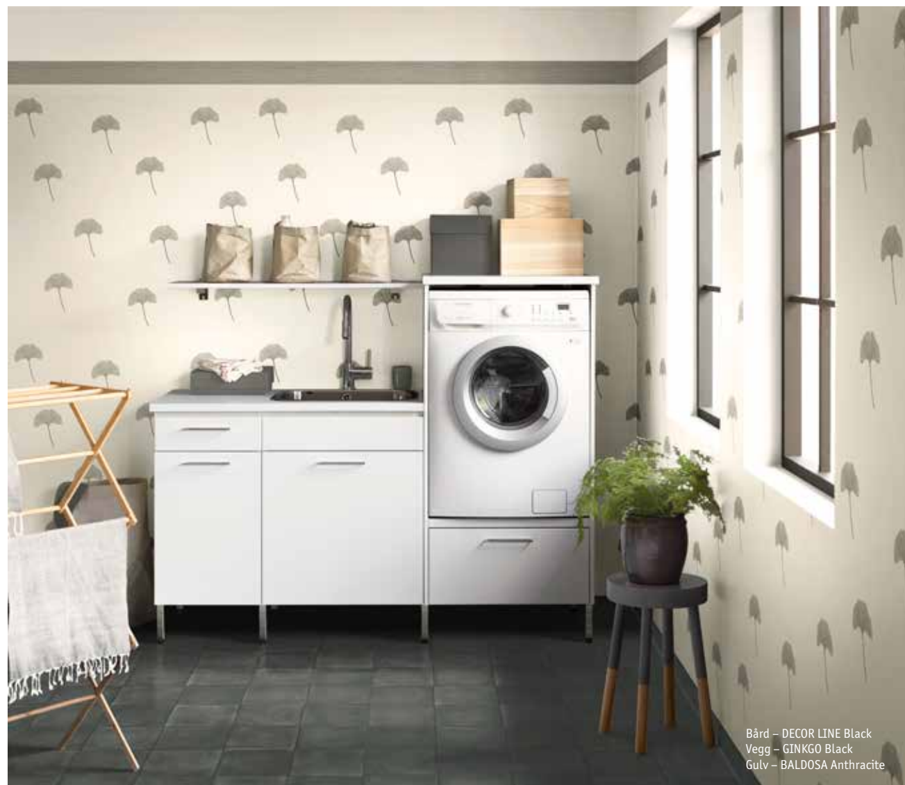
Bård – DECOR LINE Black Vegg – GINKGO Black Gulv – BALDOSA Anthracite