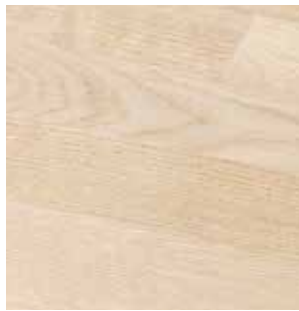
Eik ubehandlet A/B

30 x 3620 x 635 mm Rettkant 40 x 3620 x 635 mm Rettkant