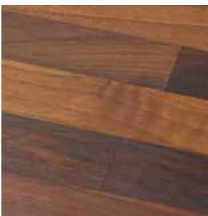
Europeisk Valnøtt B/C

27 x 3020 x 610 mm Postform R6 40 x 3020 x 610 mm Postform R6