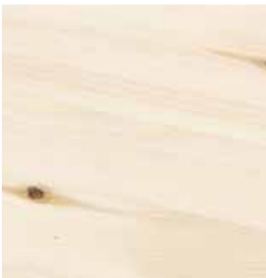
Furu ubehandlet A/B

Vær oppmerksom på at brukeren skal kontrollere produktet før bruk. Ved montering av benkeplater med feil begrenses erstatningsansvaret til benkeplatens verdi.