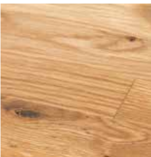
Eik grunnet m/olje B/C

30 x 3620 x 635 mm Rettkant 40 x 3620 x 635 mm Rettkant