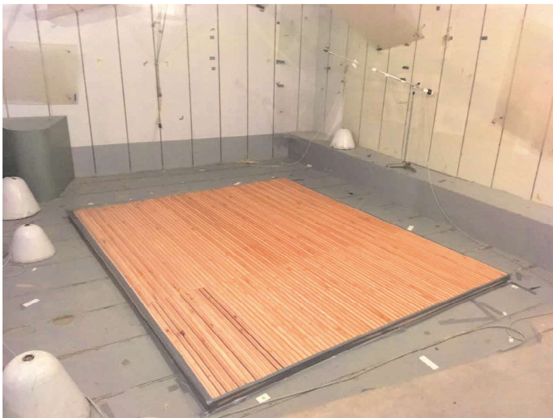
Foto af vanDookumGROUP vægpanel RCP10/13 i laboratoriet.