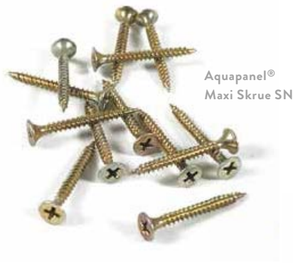
Aquapanel® Maxi Skruer SN