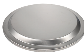
Lokk Varenr.: 25472