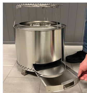
Sjekk at askeskuff er på plass