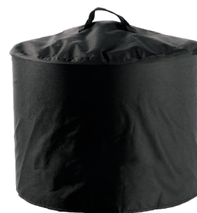
Vanntett overtrekk Varenr.: 25473