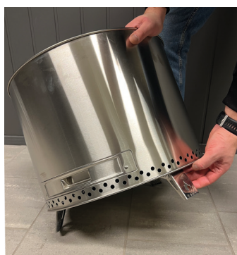
Rett ut beinene