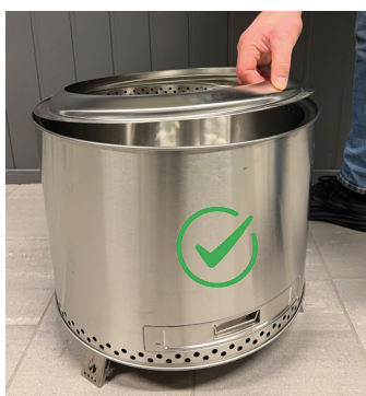
Legg toppring på plass Flens skal stikke opp