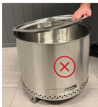
Topp ring legges feil vei!