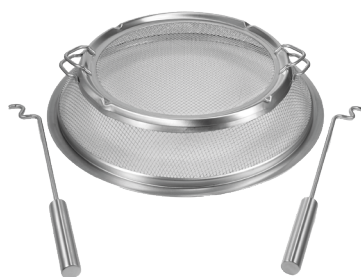
Gnistfanger m/ lokk Varenr.: 25473