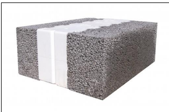
Letklinkerblok, hvid kerne