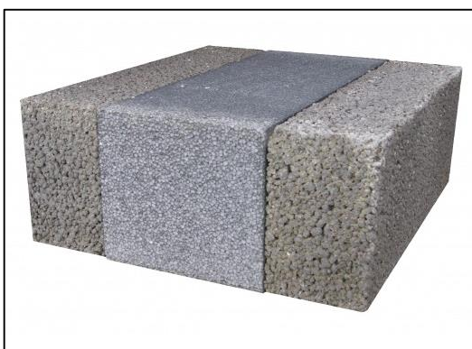
Letklinkerblok, grå kerne (med grafit)